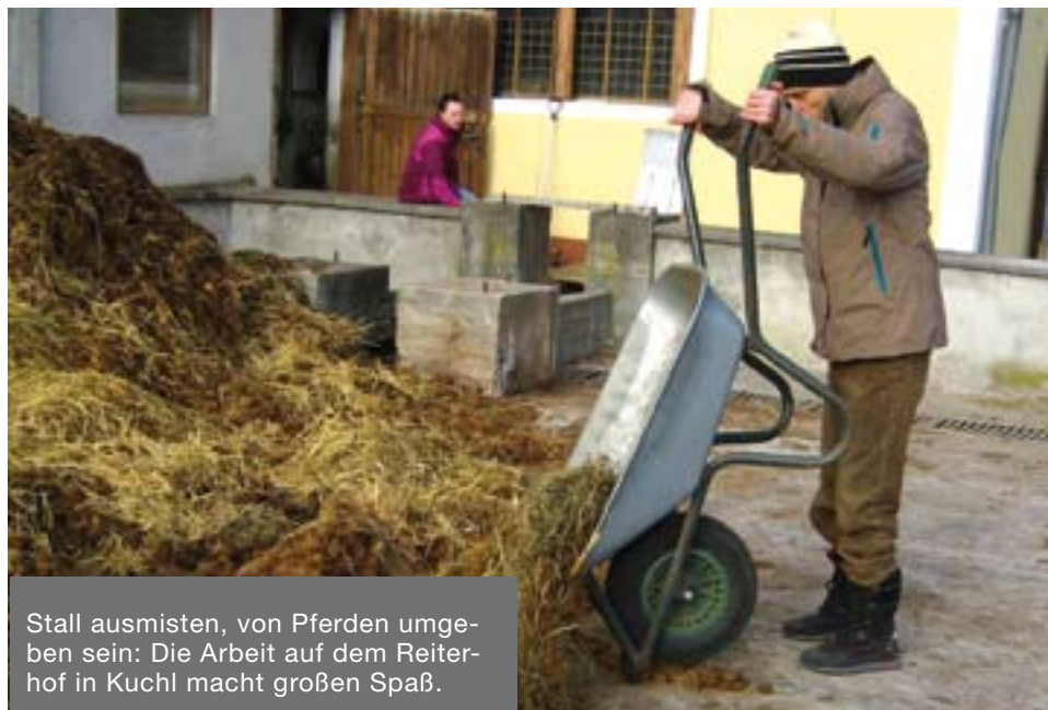
Stall ausmisten, von Pferden umgeben sein: Die Arbeit auf dem Reiterhof in Kuchl macht großen Spaß.

Menschen mit Beeinträchtigung als Kunden wahrzunehmen!