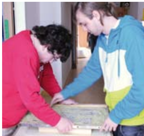
Das Abfüllen geht zu zweit leichter.