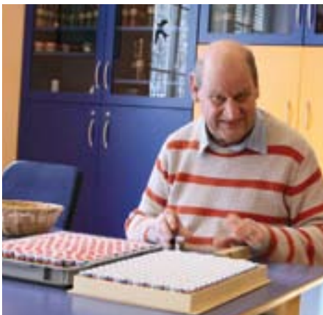
Die Salzstreuer müssen auch verschlossen werden.

So wie sich IL Doris Baumgartner und ihr