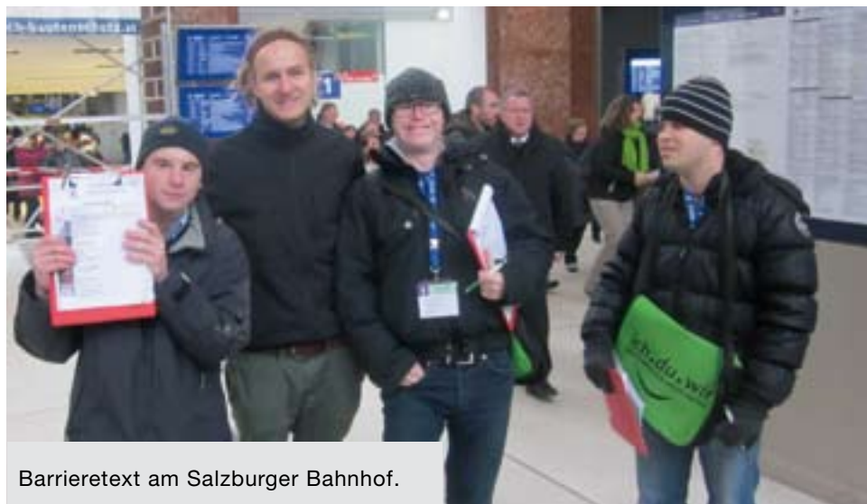
Barrieretext am Salzburger Bahnhof.